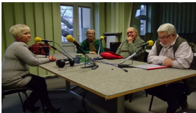
Prezentacja Parafialnego Klubu Seniora w Radiu Emaus

W maju codziennie pół godziny przed wieczorną Eucharystią będziemy odprawiać nabożeństwo ku czci Najświętszej Maryi Panny, tzw. nabożeństwo majowe.