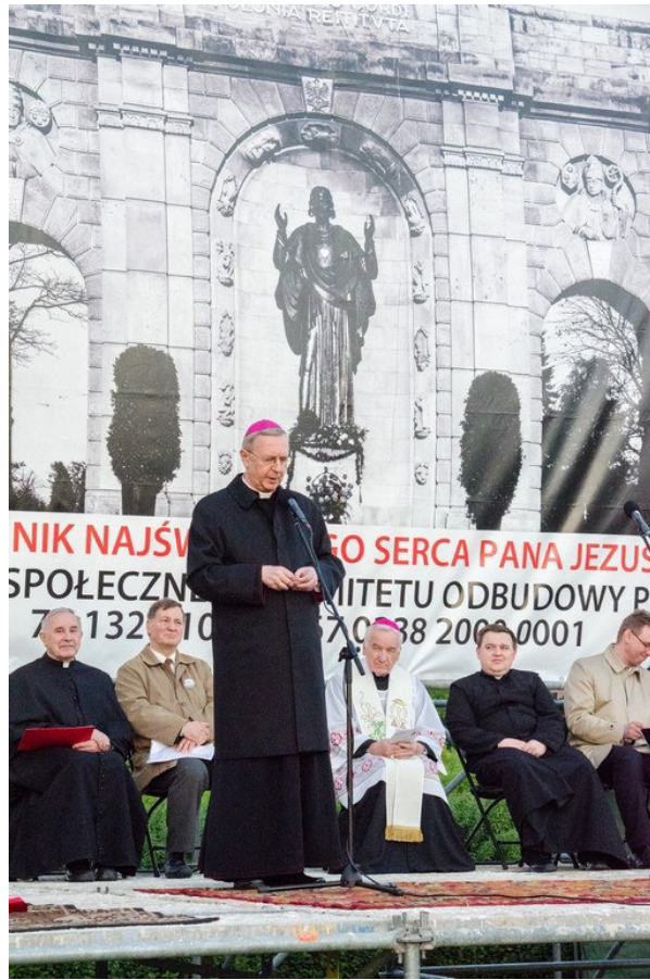
Fotografia z nabożeństwa odprawionego nad Malta, w miejscu gdzie ma stanąć pomnik

W miejscu nowej lokalizacji pomnika odbyła się jedna z uroczystości związanych z dziękczynieniem za kanonizację Jana Pawła II. Były to wzruszająca modlitwa oraz piękny koncert pieśni