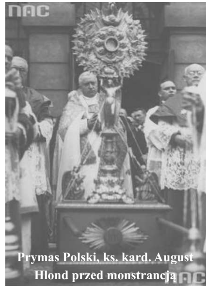
Prymas Polski, ks. kard. August Hlond przed monstrancją