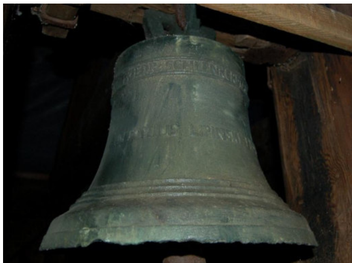
Sygnaturka z kościoła pw. Wszystkich Świętych