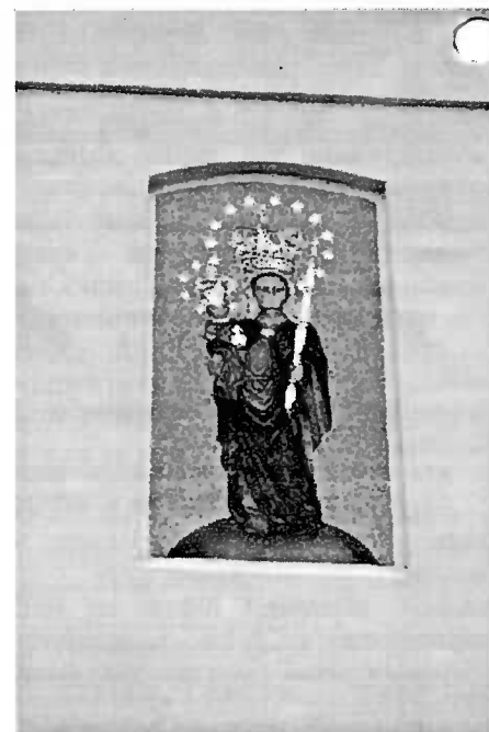
Matka Boska Patronka Rodzin Sanktuarium Maryjne w Leśniowie