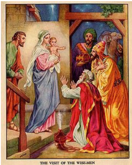
THE VISIT OF THE WISE-MEN

przynoszą dary i Mędrcy ze Wschodu składają złoto, kadzidło i mirrę. Zgodnie z ich przekonaniem, wiedzą, że tak trzeba. Także dzieci, kiedy zaglądną do Żłóbka, wiedzą, że jest już „gwiazdka” i że jest to z